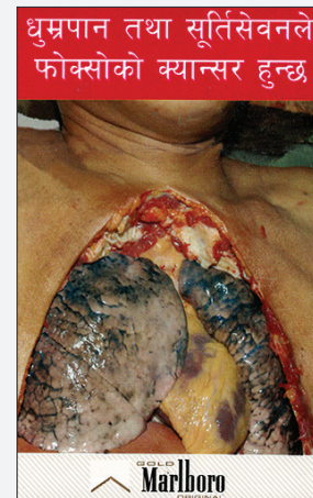
Taille : 90 % (Népal, 2016)