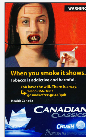
Taille : 75 % (Canada, 2012)